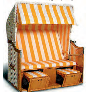
2-Sitzer XL oder XXL

In diversen Ausführungen und mit diversen Bezügen.