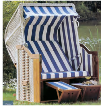
Lieferung ab Werk.