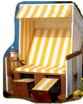
Lieferung ab Werk.

Mehrpreis für PVC-Stoff (leichter zu reinigen):