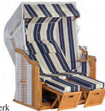
Art.MUE70017502170 ab Werk

Ostseestrandkorb mit PVC-Geflecht weiß, mit Zopf und Griffen an der Haube. Holzteile lasiert. Markisenbezug im klassischen Balkendesign blau/weiß. Beschläge verzinkt bzw. aus seewasserfestem Aluminium. 2 herausziehbare Fußstützen, 20 mm Polsterung. Rücken- & Sitzpolsterung 40/60 mm. 1 klappbarer Seitentisch. 1 gerade Sonnenmarkise. Abmessungen: ca. 120 cm x 90 cm x 160 cm (BxTxH). Gewicht ca. 70 kg: